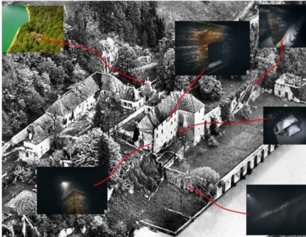
La chartreuse de Vaucluse, avec les lieux des prises de vue. Combiar

Alors André a dû s'adapter aux conditions hostiles : « J'avais une fenêtre très courte pour plonger, c'est-à-dire pas plus de dix minutes au fond, au-delà je me mettrais en danger. A cette profondeur il fait très froid, la visibilité est quasi-nulle, sans compter la présence de beaucoup de particules, et