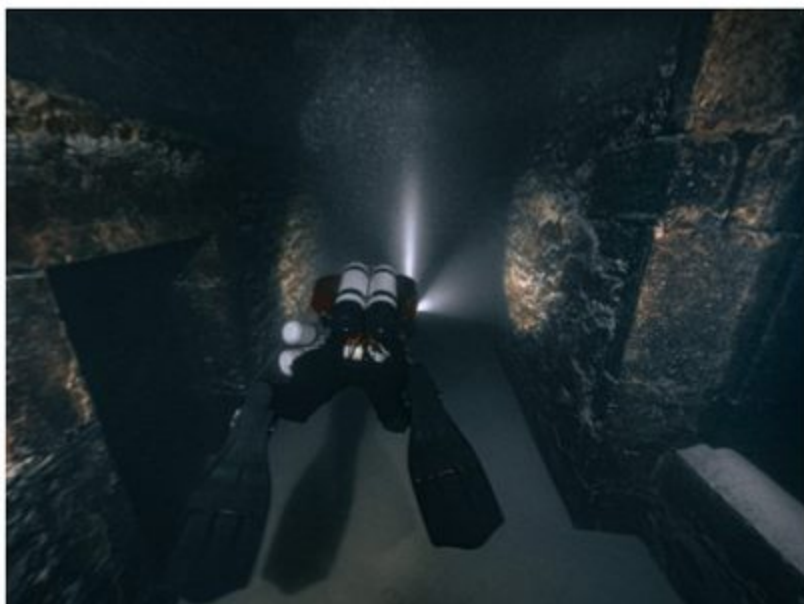
Long couloir révélant un ensemble complexe de pièces à l'intérieur du monastère. andre.piedpalmé

■ Expédition rendue possible grâce au soutien des partenaires : le Centre de plongée Carrière de Rochefontaine, Dive Factory, BigBlue Dive Lights Europe et Lowcar garage. Production : Photographies prises et fournies par André PiedPalmé : www.piedpalmé.com .